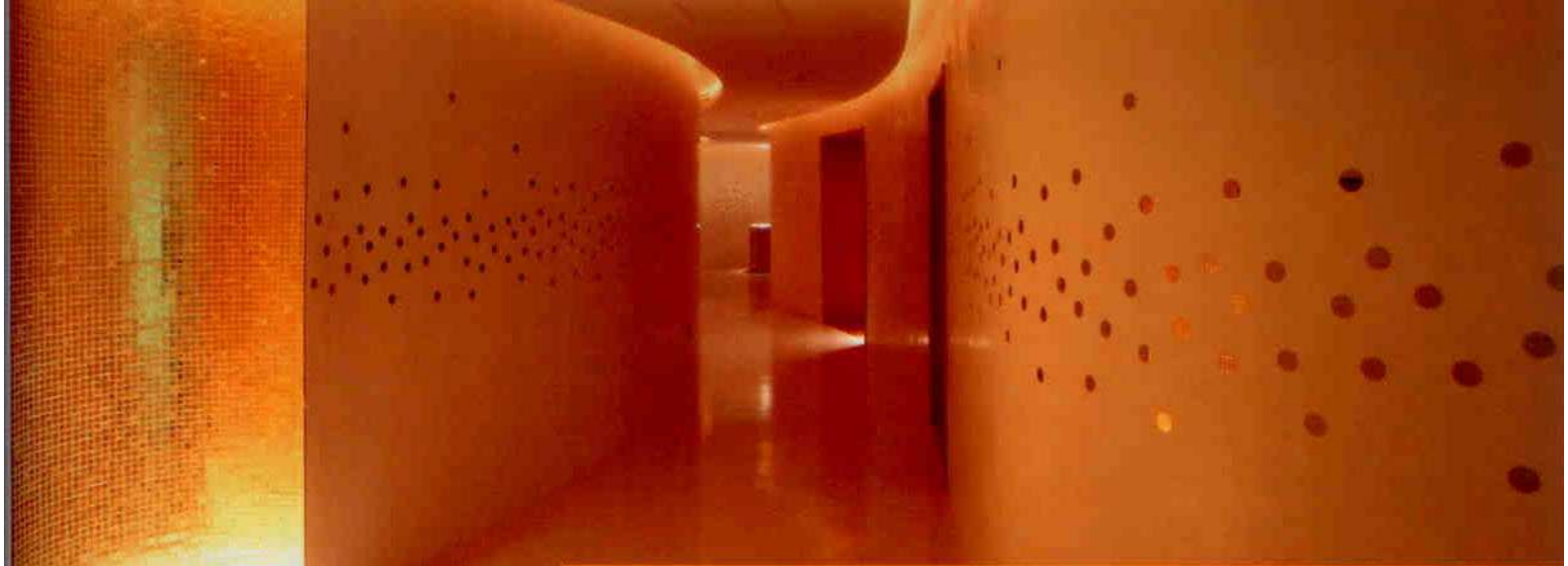
↑↓ | Le pareti dei corridoi sono state trattate con spatolato e inserti di specchietti rotondi, interpretando in chiave moderna le antiche tradizioni e decorazioni indiane | The walls of the hallways have been decorated with a spatula covering and round mirror inserts in a modern interpretation of antique Indian traditions and decorations