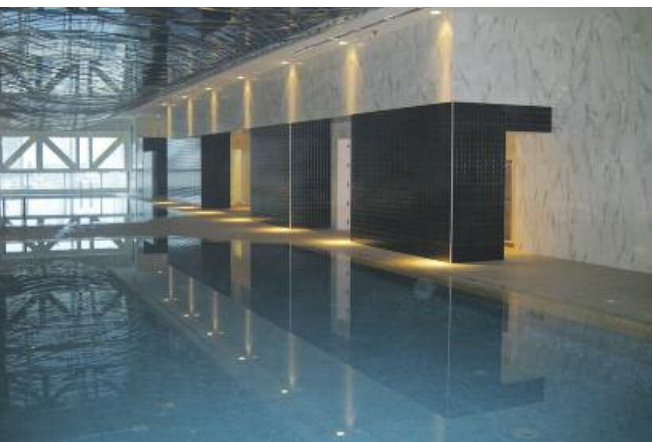
Progettazione esterni Arab Engineering Bureau, Progettazione interni Giampiero Peia e Marta Nasazzi (Peia Associati), Distributore Gulf Ceramic, Superfici ceramiche Naxos

arabici e mediorientali. L'immagine complessiva è di gusto qatariano. La progettazione integrata di tutti gli interni della sorprendente struttura (concept, dettagli costruttivi, coordinamento progettuale, direzione artistica, arredo, finiture) è stata curata dallo studio di architettura milanese Peia Associati. L'approccio stilistico è quello occidentale contemporaneo mediato con i peculiari tratti distintivi della cultura locale. Un modus operandi, radicato nel dna dello studio, teso ad attribuire una "identità" al costruito, evitando la pedissequa riproposizione di quel fastidioso "International style" uguale in ogni parte del mondo. Così nella hall d'ingresso l'esaltazione del tema del cortile arabo "sahn", con la fontana centrale e tutto intorno (a diversi livelli) le finestre "mushrabiya" (grate in legno tornito che permettono di vedere senza essere visti), è temperata dall'utilizzo di acciaio verniciato bianco e di sistemi di illuminazione ad alta